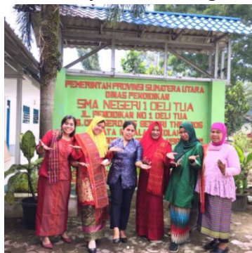
Gambar 3 Guru memakai baju Adat

Hasil wawancara dengan wali kelas XI-2, tentang pemberian pemahaman tentang kebudayaan dan cara mempertahankan nilai-nilai luhur serta cara menghargai budaya, ras, agama dan bertanggung jawab atas dirinya sesuai dengan kebinekaan kepada siswa.