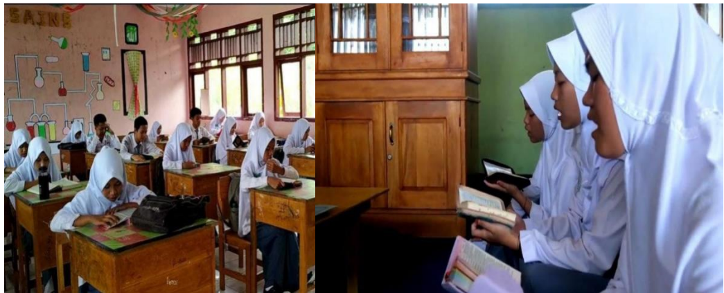
Gambar 3. Kegiatan Ekstrakurikuler Membaca Al-Qur'an Di MTs. Swasta Madinatussalam.

Hasil pada gambar di atas menunjukkan bahwa keikutsertaan dalam kegiatan ekstra kurikuler membaca Alquran di sekolah MTs meningkatkan perkembangan siswa. Swasta Madinatussalam menjadi lebih baik dan lebih baik. Oleh karena itu, wawasan yang peneliti dapatkan dari para informan adalah dibutuhkan guru sendiri untuk mengembangkan pemahaman baca Al-Qur'an anak, dan guru yang kreatif dan inovatif mengembangkan bibit-bibit unggul dari generasi ke generasi. Alquran sangat bagus sehingga tidak pada anak saja,