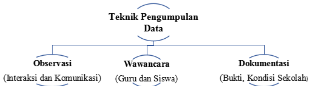
Gambar 1. Teknik pengumpulan data di Sekolah MTs.Swasta Madinatussalam.