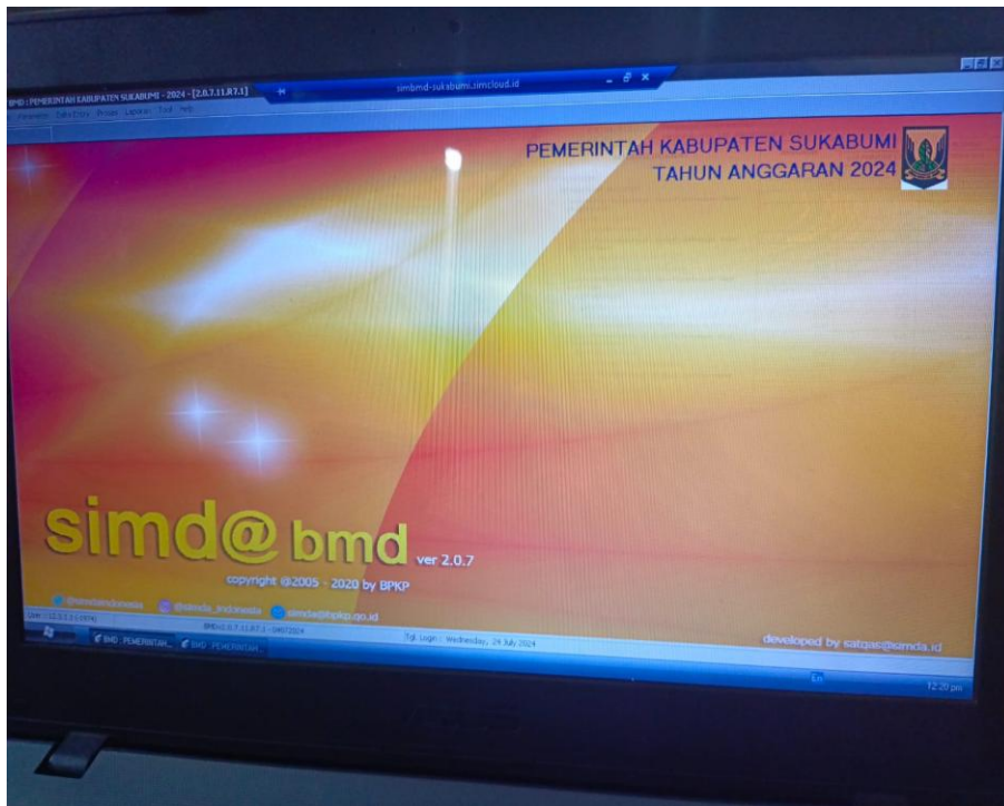
Gambar 2. Aplikasi SIMDA BMD